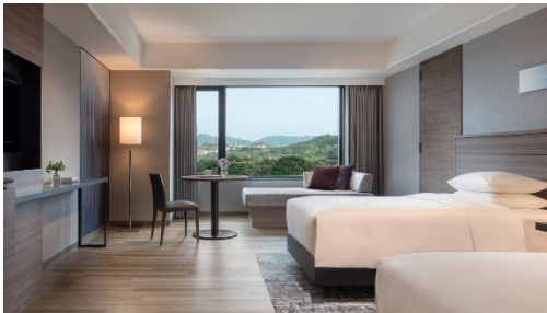
Superior room (~42sqm/452sqft)