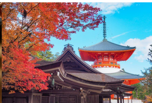
特選多個景點賞紅葉 🍁