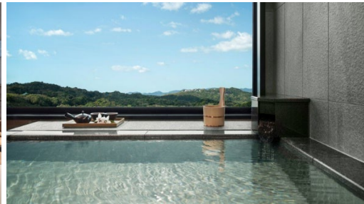
酒店頂層的海景溫泉