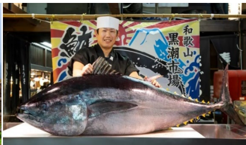
黑潮市場 金倉魚解體 show