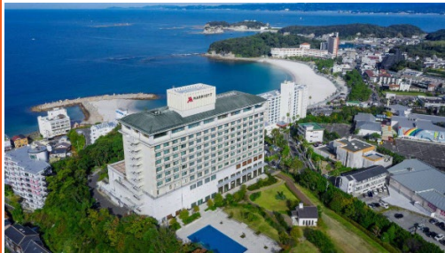
白浜 MARRIOTT 溫泉酒店

大阪關西國際機場接機 ~ 遠眺丹月島 / 白浜溫泉鄉 (行程需視乎航班時間而定)